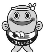
佐伯ごまだしキャラクター 佐伯ごまだし大将！

御協力ありがとうございました！ またのお越しをお待ちしております。 (一社)佐伯市観光協会