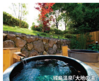
城島温泉「大地の湯」