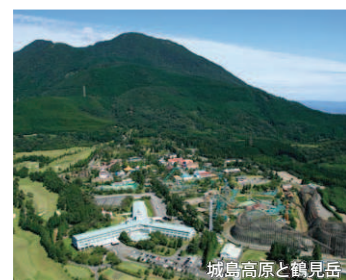
城島高原と鶴見岳