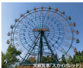
大観覧車「スカイレット」