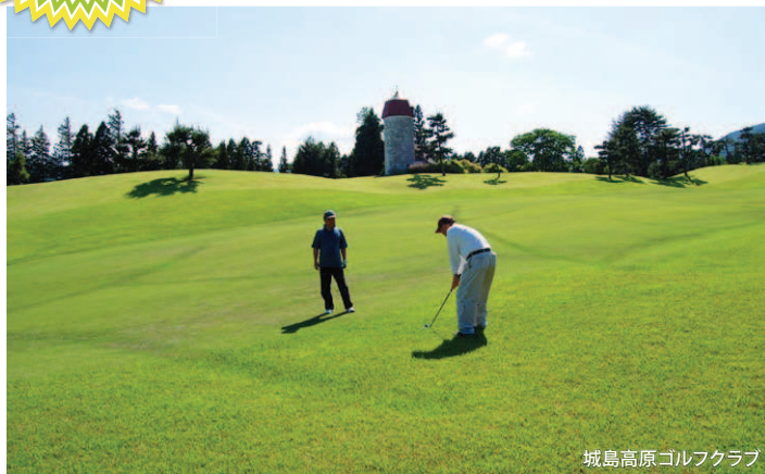
城島高原ゴルフクラブ