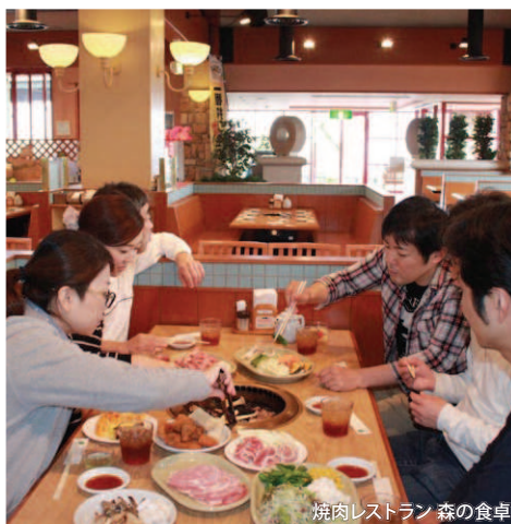
焼肉レストラン 森の食卓