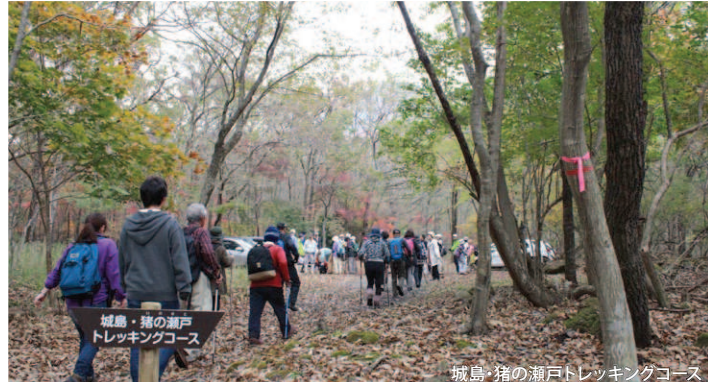
城島・猪の瀬戸トレッキングコース