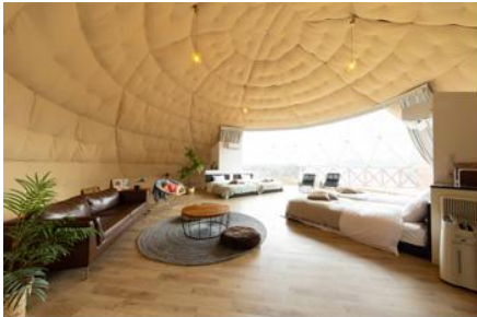
グランシア別府鉄輪(別府市)