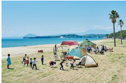
野遊び浜キャンプ場(杵築市)