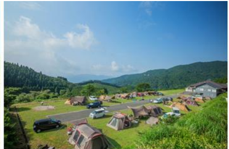
スノーピーク奥日田キャンプフィールド(日田市)

詳細は、こちらをご覧ください。 https://www.visit-oita.jp/topics/detail/563