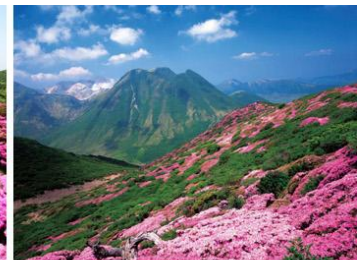
くじゅう連山(竹田市・九重町)

詳細は、こちらをご覧ください https://www.visit-oita.jp/topics/detail/182