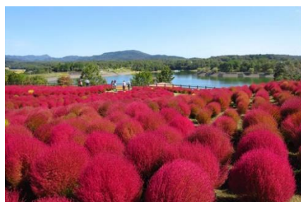
るるパーク:コキア(杵築市)