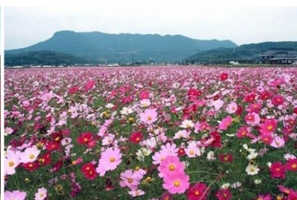
三光コスモス園:コスモス(中津市)