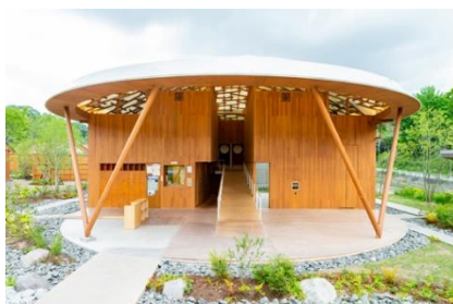
クアパーク長湯（竹田市）

日本が世界に誇る有名建築家が手がけた建物が各地に点在している大分県。今回は有名建築家が手がけた、個性豊かでオリジナリティあふれる建築物をご紹介します。