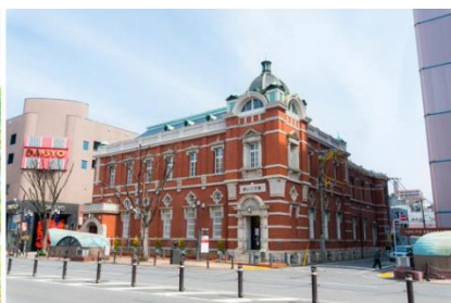
大分銀行 赤レンガ館（大分市）