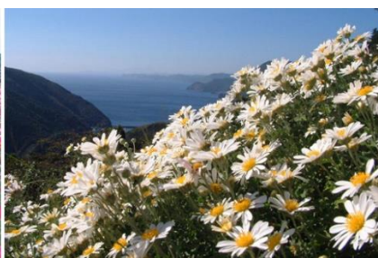
たかひら展望公園:のじく(佐伯市)

詳細は、こちらをご覧ください https://www.visit-oita.jp/topics/detail/420