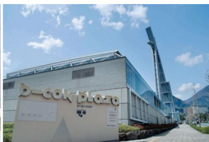
ビーコンプラザ（別府市）